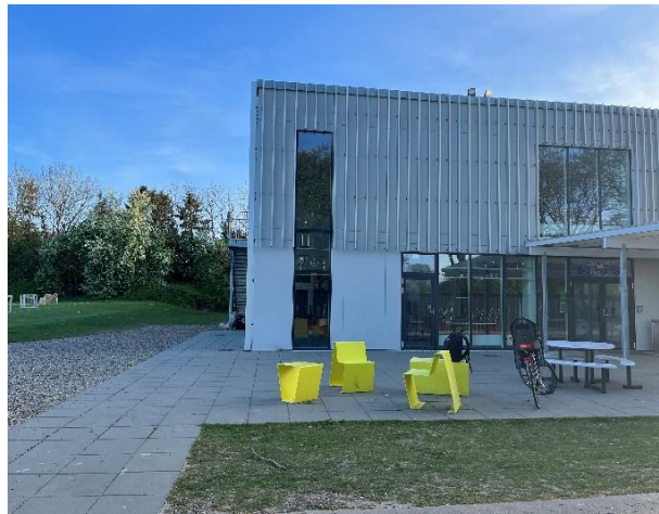
Bygningshjørne ved klubhus