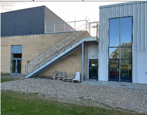
Indgang til klubhus, omklædning og flugtvej fra eksisterende hal