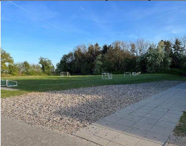
Areal hvor ny multisal ønskes opført