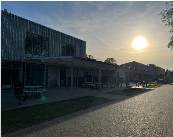
Overdækket areal for klubhus og omklædning