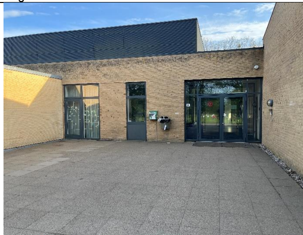
Eksisterende indgang til hallen