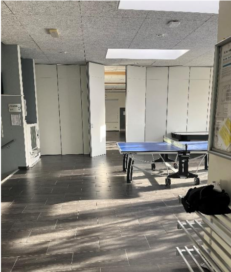
Ankomstområde i eksisterende hal