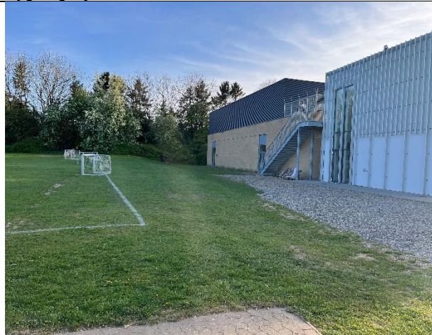
Bagsiden af eksisterende hal